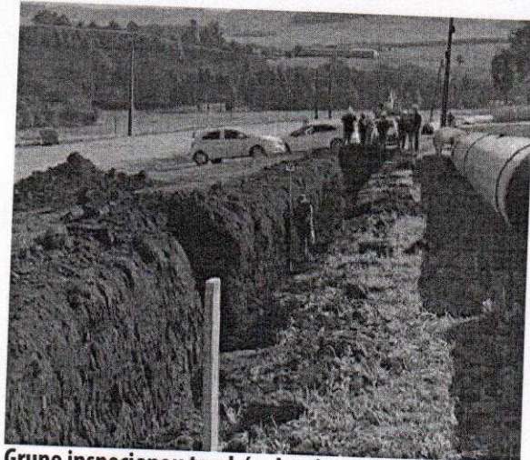
Grupo inspecionou também locais em que já ocorre o aço

Outro local vistoriado foi o terreno que está em fase de terraplanagem para início da construção das fundações da Estação de Tratamento de Água, às margens da rodovia SC-480, no município de Xanxerê. A ETA terá capacidade de tratar 1.252 litros/se-